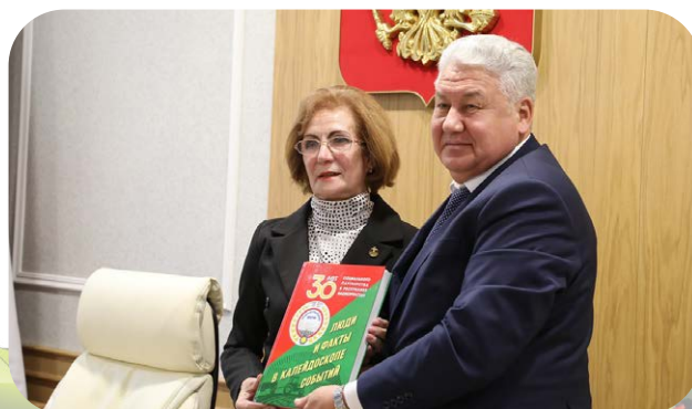
Информация Башкирской республиканской организации Профсоюза

В ходе заседания рассмотрены законопроекты о внесении изменений в Законы Республики Башкортостан «О регулировании земельных отношений в Республике Башкортостан», «Об обеспечении плодородия земель сельскохозяйственного назначения в Республике Башкортостан», «О мелиорации земель».