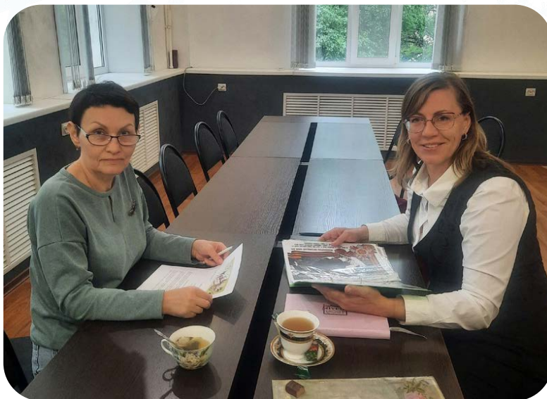
Информация Псковской областной организации Профсоюза